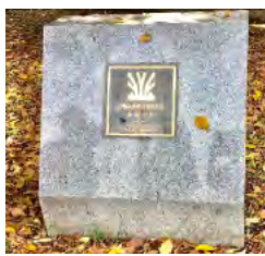
【写真⑧】 都市公園百選プレート

公園ができたころは、旭川に住んでいる人たちが一齊に集まれる場所がありませんでした。「みんなで集まれる場所を作りたい」という想いから、当時の人たちは、旭川を中心にこの公園を作ったのかもしれません。