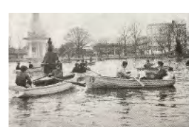
【写真⑦】 千鳥ヶ池でボートに乗っている様子（昭和33年） 【知らなかった、こんな旭川】NHK旭川放送局編著 中西出版