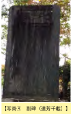
【写真④】 副碑（遺芳千載）