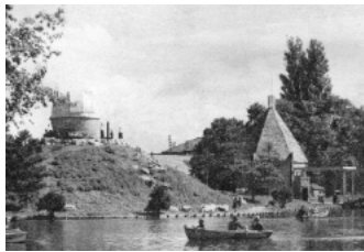
【写真②】 常磐公園の様子 (昭和26年頃)