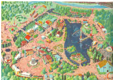
【写真③】 北海道開発大博覧会のイメージ図