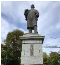
【写真⑥】 永山武四郎像