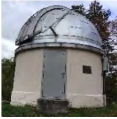
【写真①】 旭川旧天文台

大博覧会を機に、旭川は大きく成長したそうです。つまり、今残っている「天文台」は、旭川市民にとって大切なものなのです。なぜなら、旭川が大きく発展するきっかけとなった大イベントの記憶を物語るものだからです。