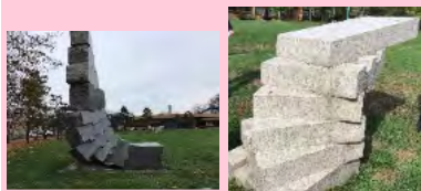
【写真②「空 充秋/生きる」】 【写真③「空 充秋/地」】