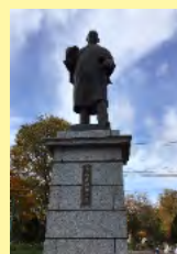
【写真④「永山武四郎像」】